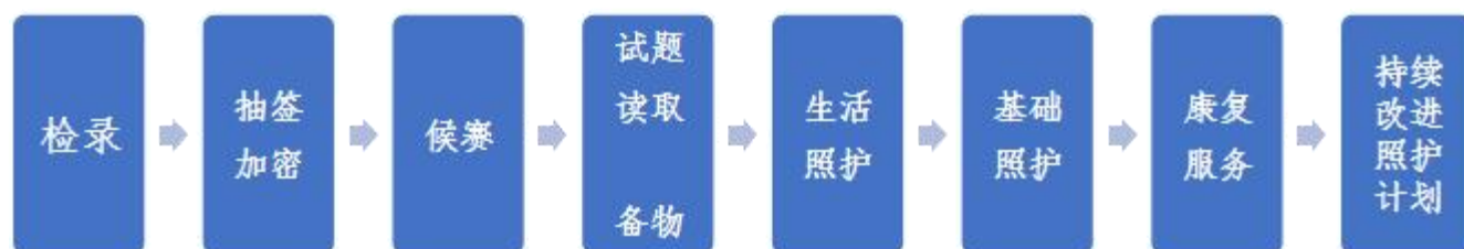
图2 参赛选手竞赛流程图

各参赛选手完成试题读取、备物后，持赛题案例、用物依次进入生活照护、基础照护、康复服务三个赛室，最后进入持续改进照护计划赛室。第一天、第二天竞赛流程一致。